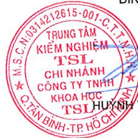
HUYỀN TÂN CƯỜNG