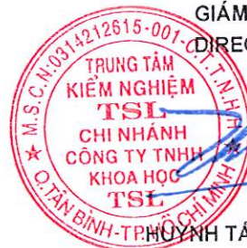
HUYỀN TÂN CƯỜNG