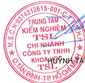
HUYỀN TÂN CƯỜNG