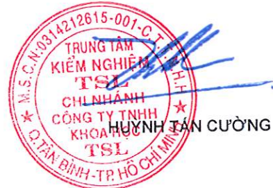
HUYỄN TÂN CƯỜNG