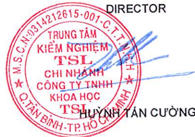
HUỖNH TÂN CƯỜNG