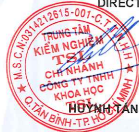
HUYNH TÂN CƯỜNG