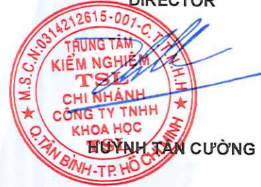
HUỖNH TÂN CƯỜNG