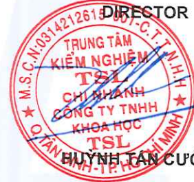
HUỖNH TÂN CƯỜNG