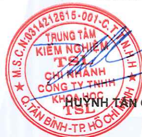
HUYỀN TÂN CƯỜNG