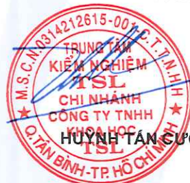
HUỶNH TÂN CƯỜNG