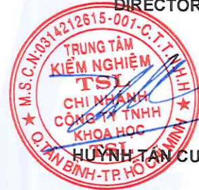
HUỲNH TÂN CƯỜNG