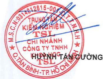
HUỶNH TÂN CƯỜNG