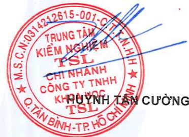
HUỲNH TÂN CƯỜNG