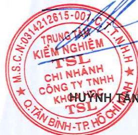
HUYỀN TÂN CƯỜNG